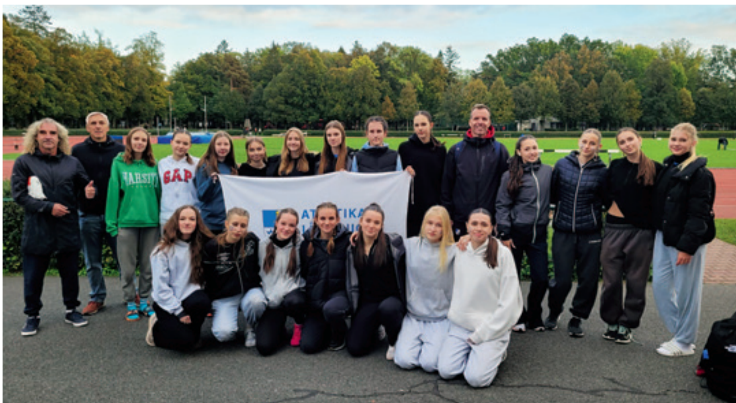
Mistrovství České republiky, dorost, Kladno

Tým Atletiky Líbeznice