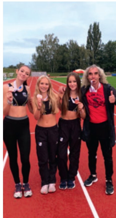
Mistrovství České republiky, žactvo, Nové město nad Metují

Disciplín je mnoho a ne všechny máme pokryté, i když s námi hostují i dorostenky z Atletiky Stará Boleslav, které pomáhají zejména v těch disciplínách, kde nemáme zastoupení. V dorostenkách máme díky nízkému počtu atletek ročníku 2007 a 2008 také na „pomoc“ starší žákyně, které ale v této soutěži mohou startovat pouze ve dvou disciplínách, nikoli ve třech. To se také projevilo zde,