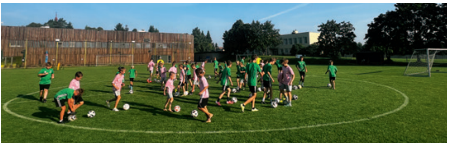
Fotbalový kemp 2024