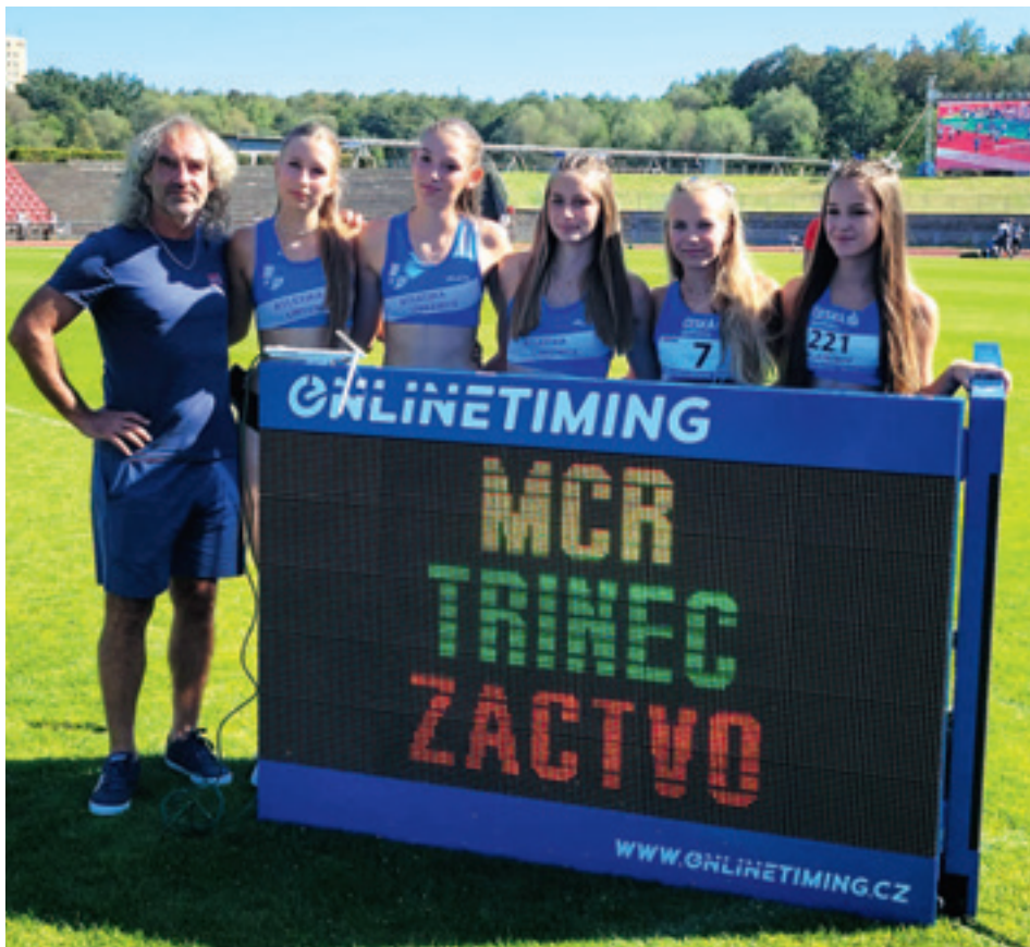
Mistrovství České republiky, žactvo – jednotlivci, Třinec