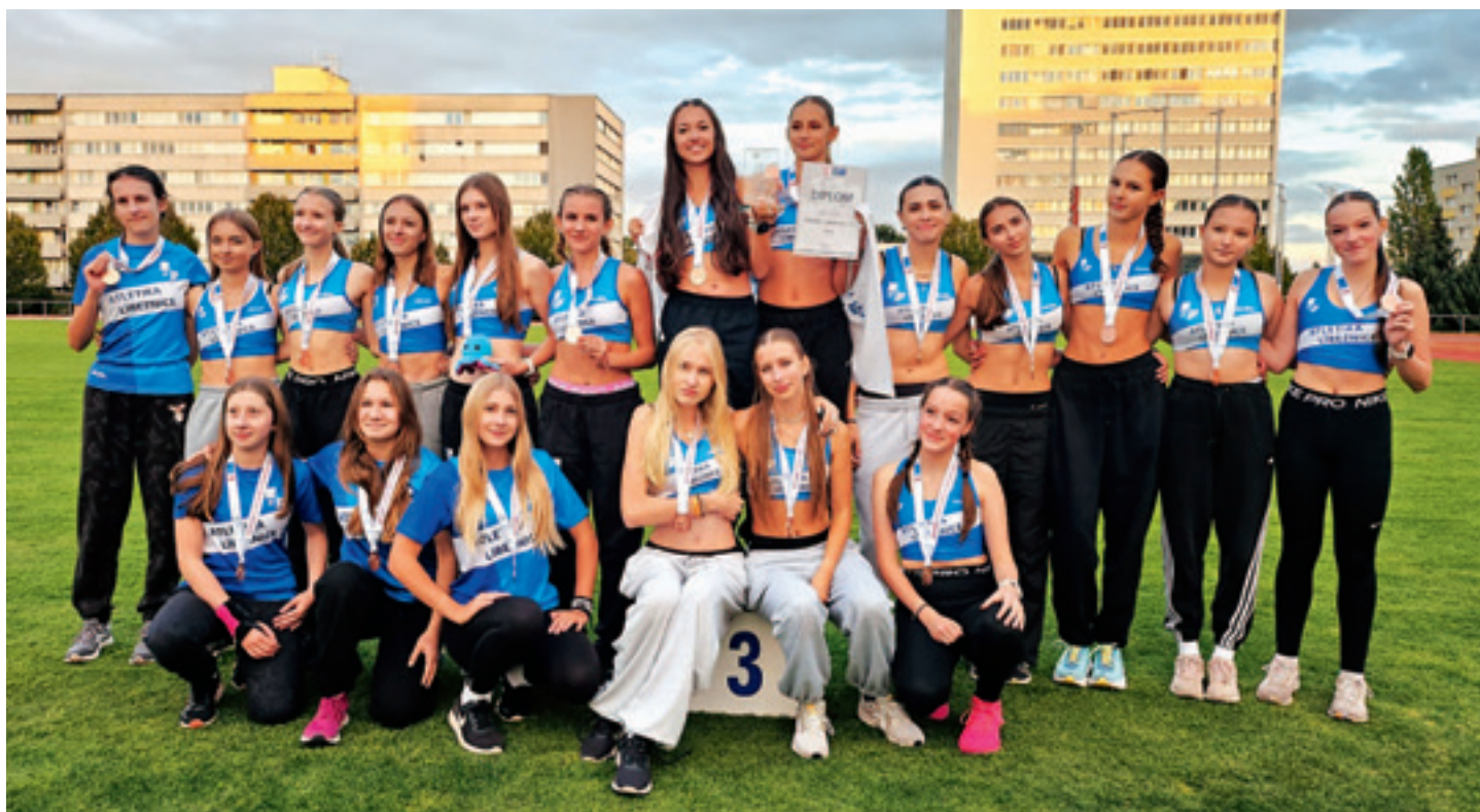
Mistrovství České republiky, dorost, Mladá Boleslav

Ačkoli je tato sezona díky posunutí hlavních závodů již velmi dlouhá a začínají se objevovat různé bolístky a neduhy, naše dorostenky bojovaly jako lvice a ukázaly veliké nasazení a týmového ducha.