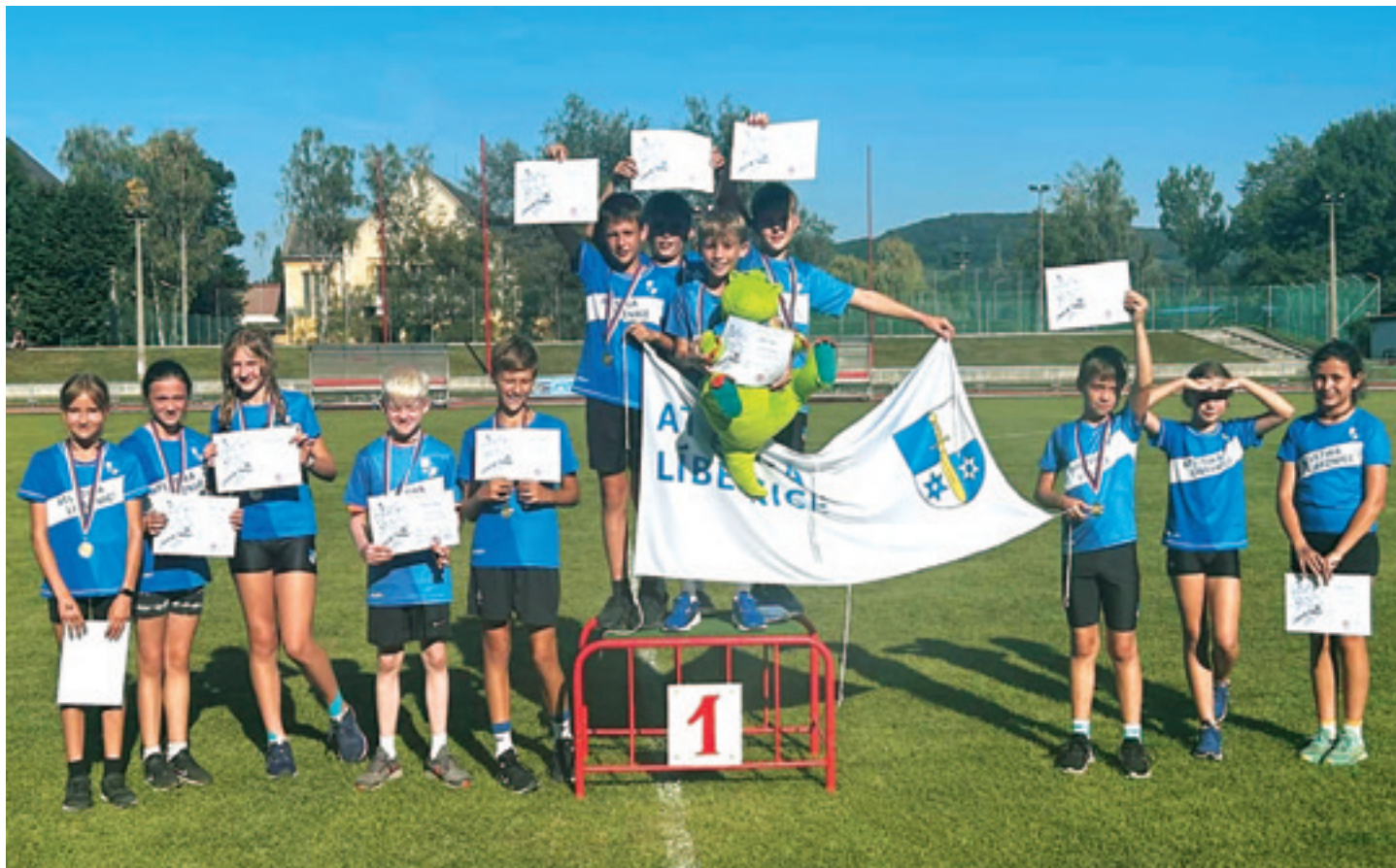
Zlaté družstvo přípravy 1 – Beroun 2024

Tým Atletiky Líbeznice