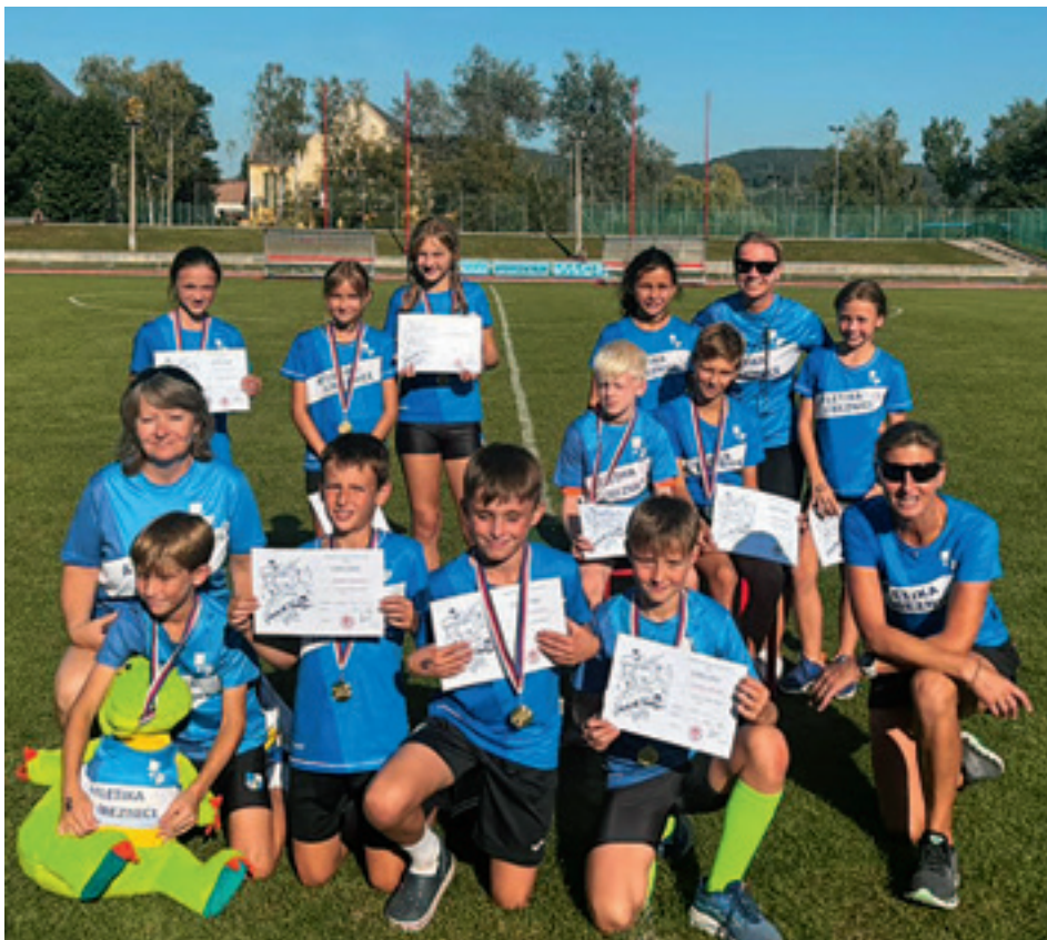
Zlaté družstvo přípravy 2 – Beroun 2024

A pak to přišlo. Zástupy všech 25 družstev a vyhlášení od konce – neskončili jsme ani na pátém, ani na čtvrtém místě, napětí houstlo, všichni jsme se chytli za ruce a mačkali. Nejsme ani na třetím,