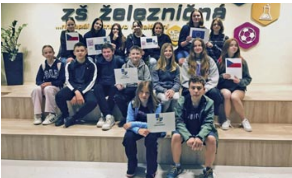
Líbezníční žáci v Bratislavě

Květen proběhl ve znamení hned několika akcí – první byl další výjezd učitele na vzdělávací pobyt