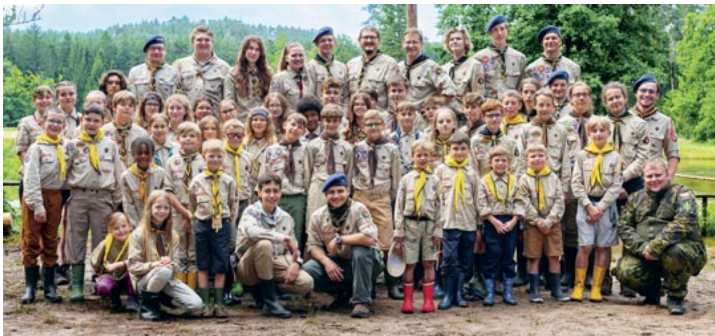
Amazonky, Surikaty, Vlčí důl