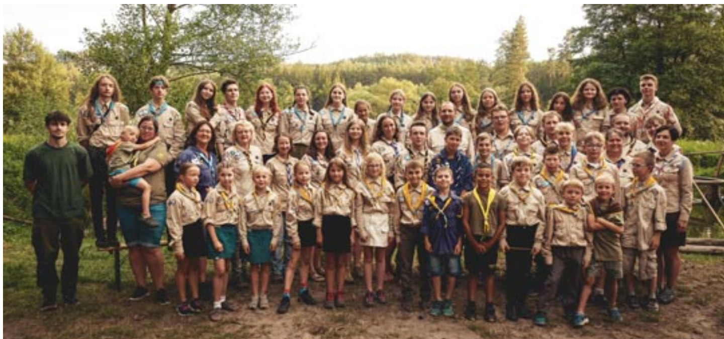
Štikaři a Stopaři