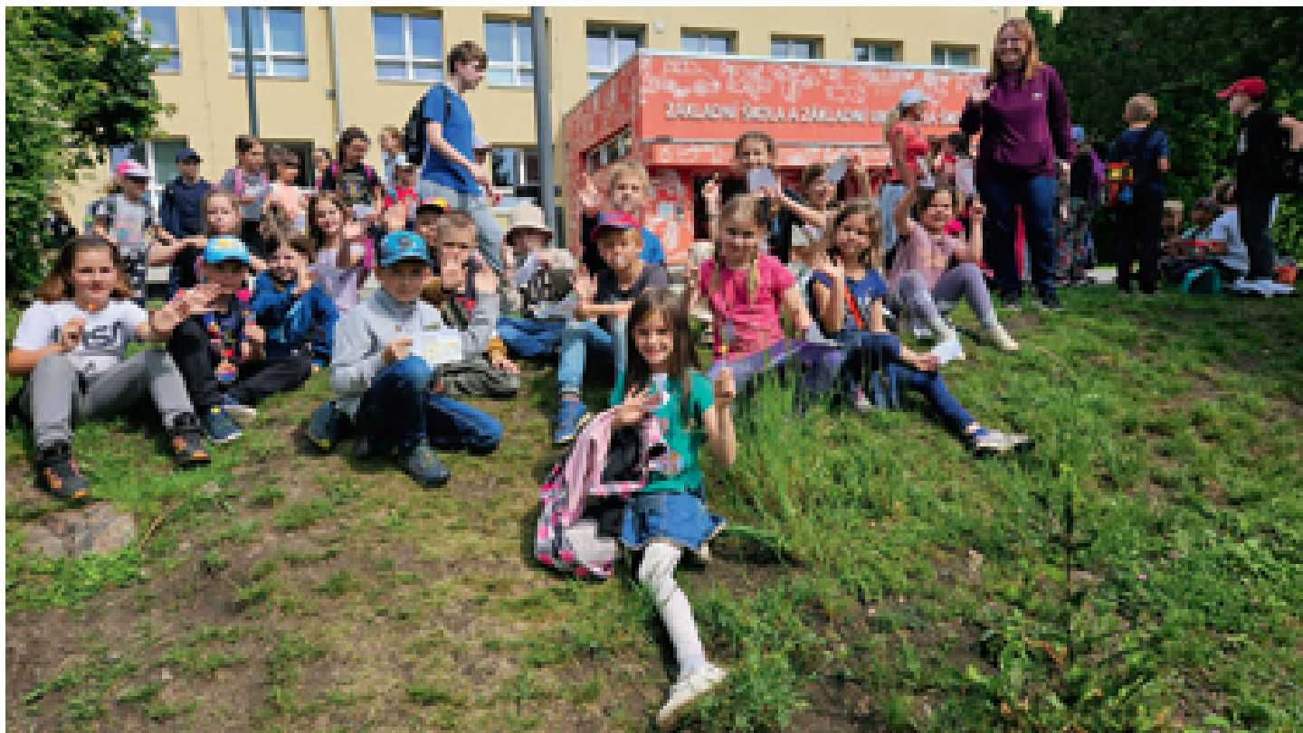
Dětský den na líbeznické škole