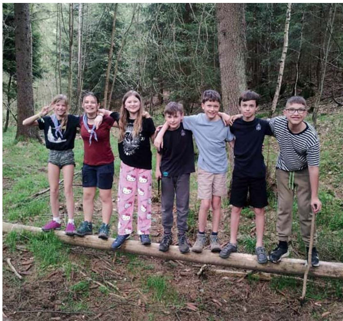
5. Oceán – výprava do Jizerek