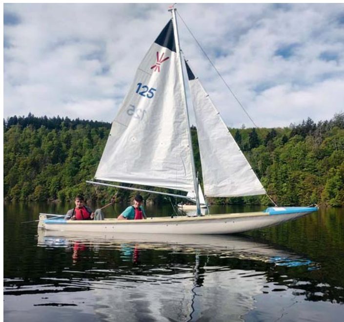
5. Oceán – plachtění