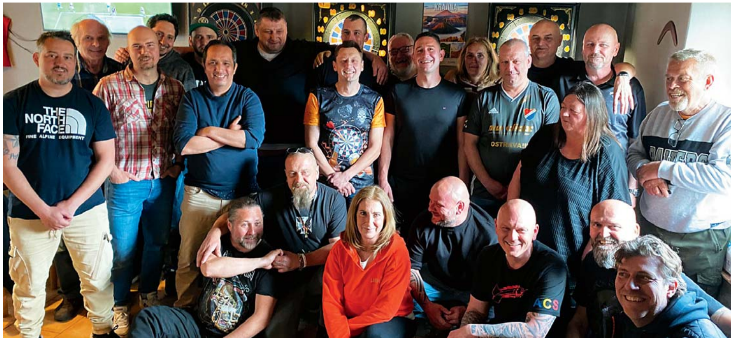
Účastníci turnaje za...