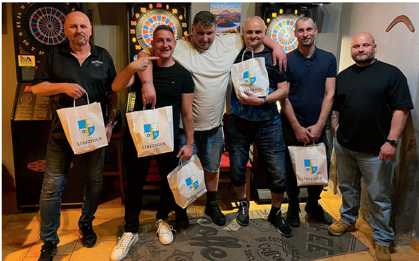
...a jeho vítězové