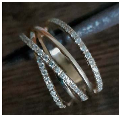
Jeden z výrobků – zlatý prsten