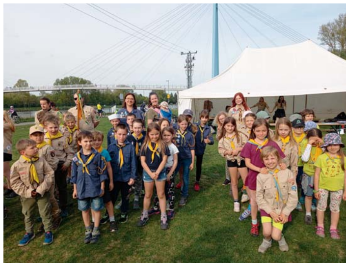
Závod Vlačů a Světlušek