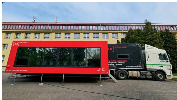
Kamion FabLab před líbeznickou školou