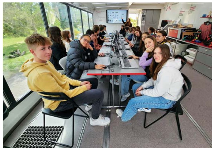
Přednáška uvnitř kamionu