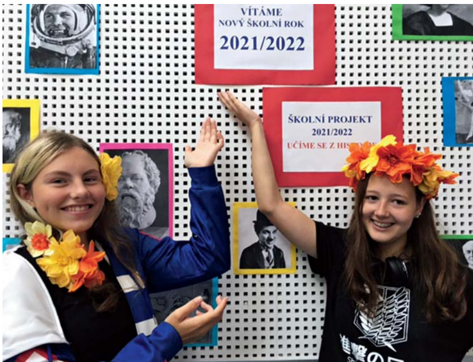
Žáci očekávají nový projekt s úsměvem

Ve škole dále proběhne několik přednášek současných historiků . Pokud to situace dovolí, uspořádají děti z líbeznické školy tradiční vánoční vystoupení pro babičky a dědečky v domově dů-