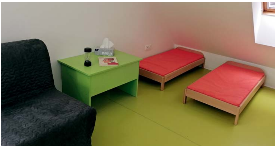
Místo pro odpočinek

Po obědě pár dětí odejde a pro ostatní nastává klidový režim. Ten je pro všechny mateřské školy závazný. Je čas si odpočinout, vstřebat zážitky, události dopoledne, popřemýšlet o získaných vědomostech, zamyslet se nad nezdary... Děti si lehnou na lehátka a všichni poslouchají čtenou pohádku, příběh nebo další kapitolu z rozečtené knihy. Už jen tímto se děti učí pozornosti, soustředění, porozumění čtenému. Pár dětí usne ještě před dočtením. Ty, které neusnou, pouze odpočívají. Celý odpoči-