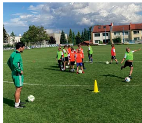
Zlepšování kopací techniky

Díky novým dresům, tréninkové kempové sadám už po trávníku Na Chrupavce neběhají Ronaldo, Messi, Mbappé nebo Lewandowski. Ale malí kluci s jasnou příslušností k 1. FC Líbeznice.