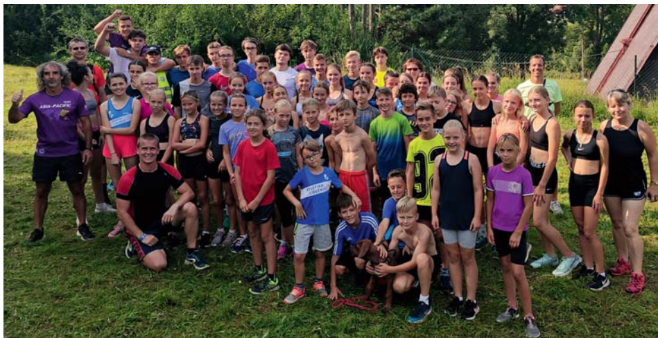
Atleti na soustředění