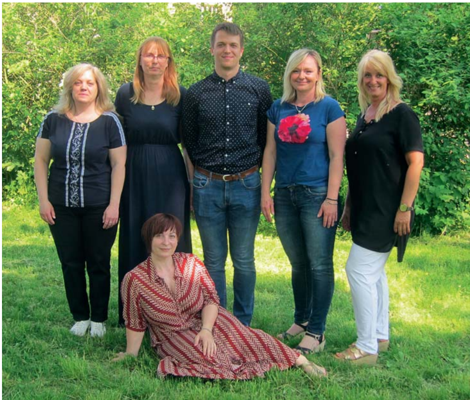
Tým Hospice Tempus

Pan Karel: Hospicové služby jsme využívali přibližně 1,5 měsíce. Na počátku k nám dojížděla sestřička