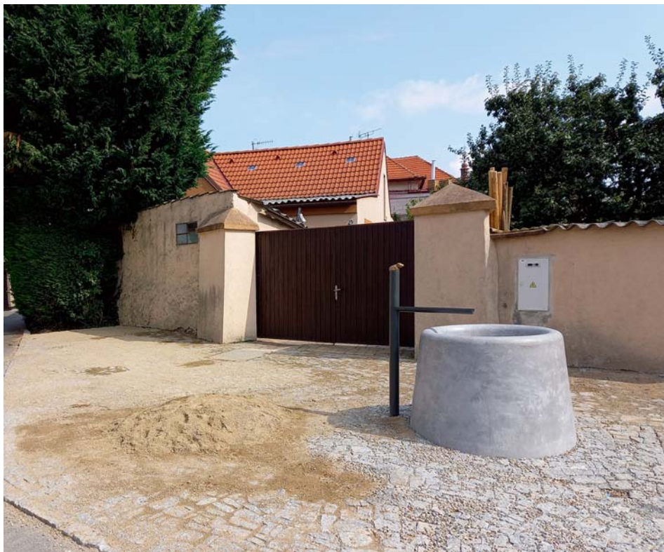
Nová kašna v ulici U Kola