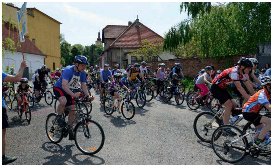
Start závodu Kolem kolem Líbeznice