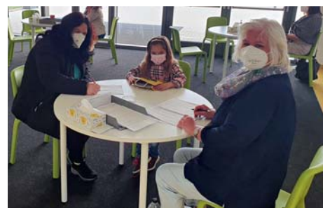
Zápis do školy proběhl opět ve zjednodušené formě

Líbeznická škola sbírá přihlášky do první třídy až do konce dubna, potom dojde k celkovému vyhodnocení, správnému řízení a postupnému obesílání rodičů s rozhodnutím o přijetí. „Na jednu stranu máme velkou radost, že je o líbeznickou školu zájem, na druhou stranu nám počet přihlášek přináší starost,