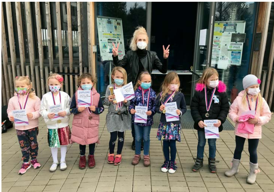
Vyhlášení výsledků taneční soutěže