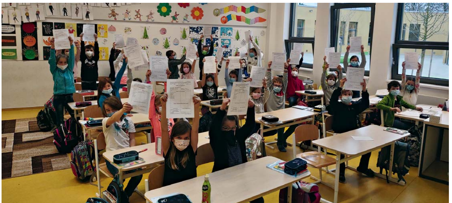
Některé děti si vysvědčení vyzvedly až v dubnu