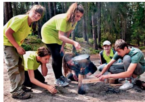
Skauti na letním táboře

Skauti z líbeznického střediska jezdí do přírody tak často, jak to jen jde. Vědí, že příroda je tou nej-