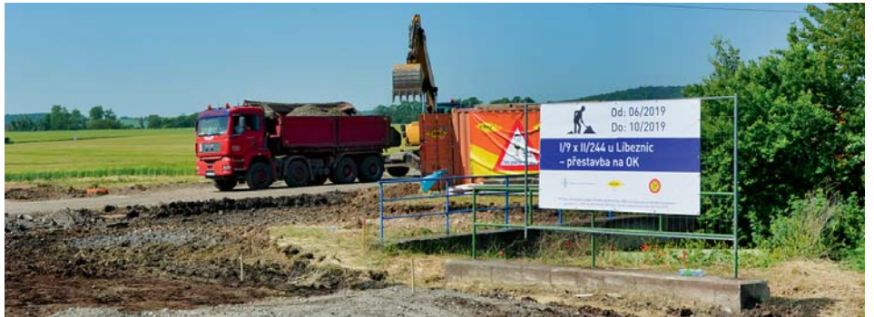
Stavební práce na nové křižovatce

Nová bezpečnější křižovatka by měla být hotová na podzim. Doprava je zde řízena kyvadlově, většinu času ji řídí pracovníci stavby – konkrétně od šesté hodiny ráno do půl dvanácté a potom od jedné hodiny do sedmi hodin večerních. Pracovníci stavby mohou lépe reagovat na vznikající kolony a řídit tok vozidel tak, aby kolony byly co nejmenší a nezpůsobovaly dopravní komplikace. Přes poledne a během noci je doprava řízena semaforem. I tento způsob řízení dopravy má vliv na to, že intenzita dopravy v Líbeznicích výrazně nepřekračuje běžné ranní špičky. V odpoledních hodinách je pak doprava již částečně rozmělněna do většího časového období a situace je lepší než ráno. Dobrou zprávou také je, že stavba kruhové křižovatky zasáhne do prázdnin, kdy je doprava klidnější, což jistě bude mít vliv i na celkový provoz v Líbeznicích.