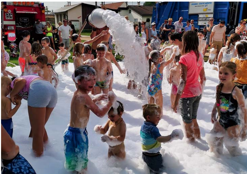
Děti řádily v hasičské pěně

První možnost, jak se seznámit s jejich činností, měly děti (a vlastně i jejich rodiče) na stanovištích, která tyto organizace zajišťovaly v rámci dětského dne. Děti si tak mohly vyzkoušet, jak pracují hasiči, a naučit se rozmotávat hadici. Ti, kdo mají zálibu v rukodělné práci, si mohli se Stonožkou vyrobit kytku. Kdo má rád přírodu, les a tábory, mohl si vyzkoušet některé z úkolů připravených skauty ze střediska WILLI. Zahradkáři si letos připravili důmyslnou poznávačku nejrůznějších plodin. Na stanovišti MAS Nad Prahou bylo také možné si vyzkoušet, zda děti poznají kožešiny a stopy jednotlivých zvířat. Milovníci lega a stavebnic se mohli vyřádit u stanoviště organizace Jedu Edu. Soutěžilo se také v golfu nebo v angličtině.