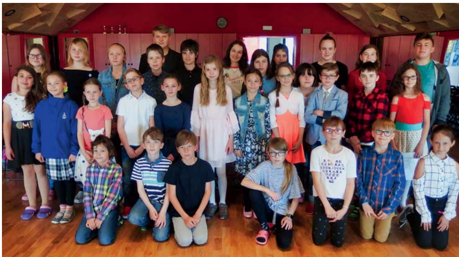
Všech 31 účastníků, kteří se zúčastnili literární soutěže

Ta vytvořila také hlavní cenu – lákavý dort ve tvaru bubliny. Letos si tuto sladkou odměnu odvezla