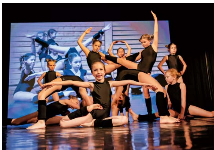
„Tanec je píseň těla“