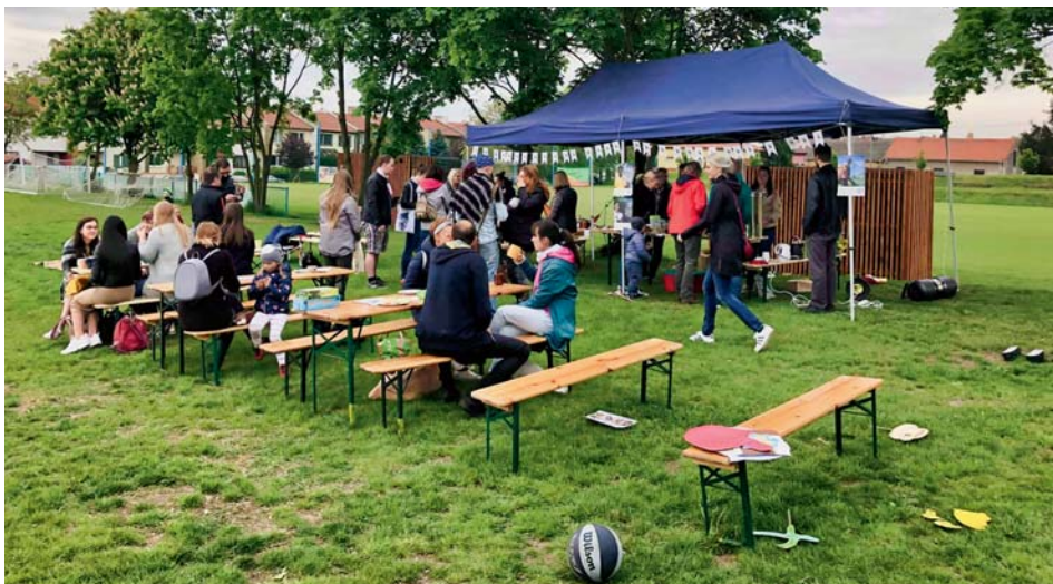
Stánek s ochutnávkami