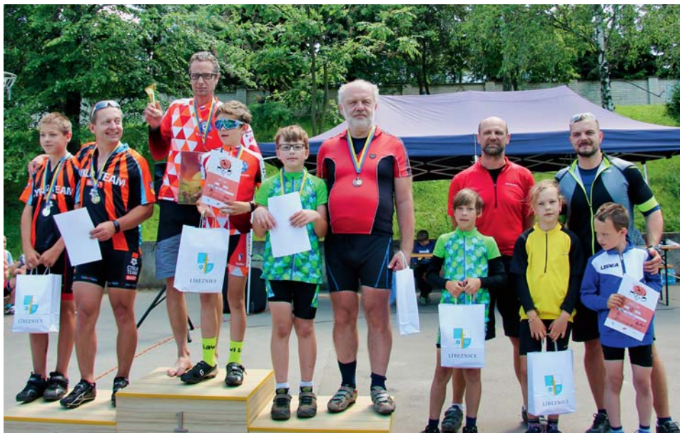
Zástupci rodiny na stupních vítězů

„Vysbírat“ všech dvacet kontrol znamenalo najet nejméně 70 kilometrů, a to za předpokladu vhodně zvolené trasy bez velkého bloudění. To se