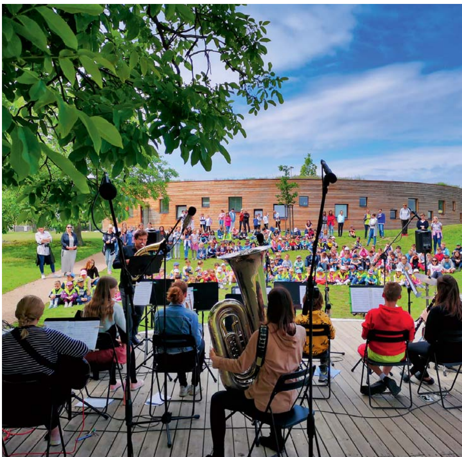
Vystoupení dechového orchestru

V sobotu 1. června se pěvecké sbory Líbezníček a Líbeznělky vydaly reprezentovat školu na ZUŠpáradu pořádanou středočeskými základními uměleckými školami. V krásném prostředí zámku a zámecké zahrady v Litni byl tento krajský happening ZUŠ Open příjemným místem setkání a zdrojem inspirace pro další práci. Kromě tří vystoupení, která