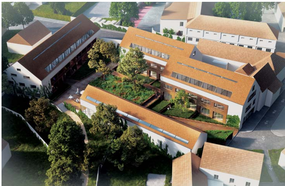
Návrh nové podoby lokality U Kovárny