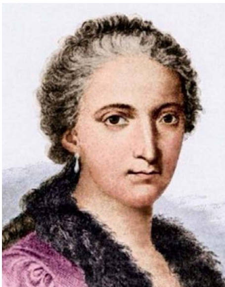
María Gaetana Agnesi

Po roce 1739 se Maria úplně uzavřela před světem a chtěla vstoupit do kláštera. Na otcovo naléhání zůstala v jeho domě, ale stranila se společnosti a žila jen studiem náboženských a matematických knih. Pří-