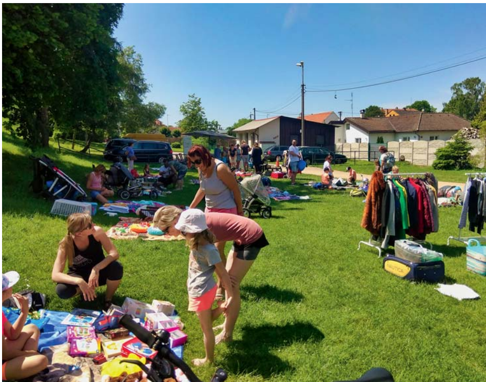
Nabídka byla pestrá