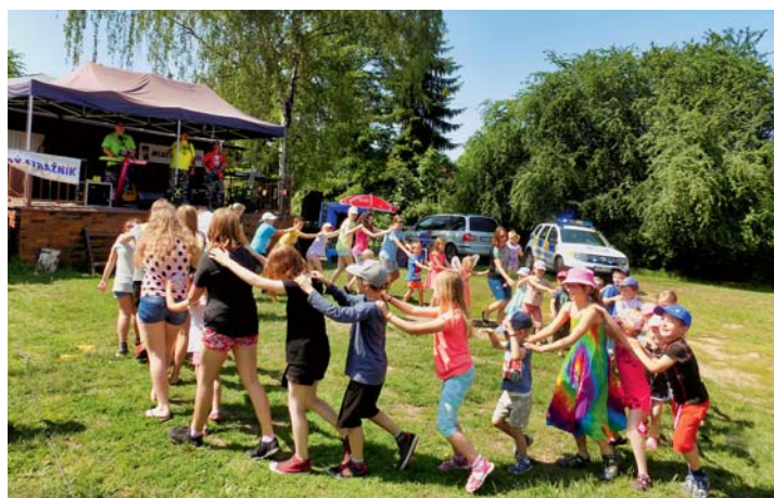
Momenty ze soutěžního dne