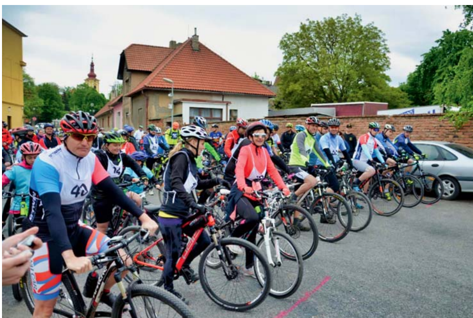
Start letošních účastníků

Kategorie jednotlivců se z Veleně vydala po delší trase přes Sluhy a všechna přílehlá pole a kopce přes Měšice zpět do Líbeznic. Vidina vítězství v po-